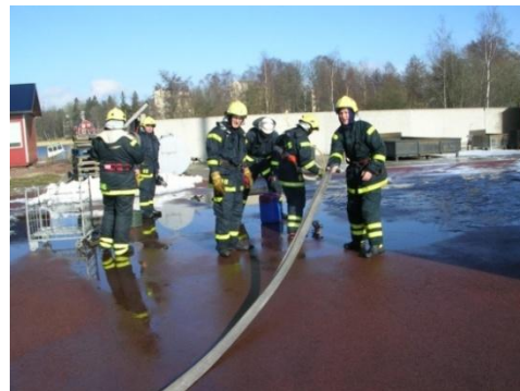
Kurs i släckningsarbete