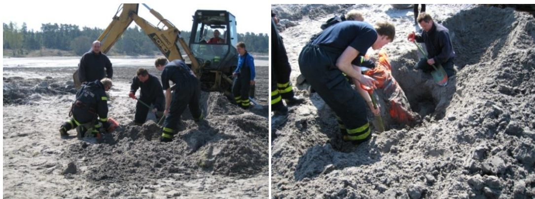
Vad har hänt här?

Den 5 maj arrangerades vårmanövern med Eckerö FBK som arrangörer. I manövern deltog 6 avtalsbrandkårer och 55 personer. Kårerna fick besöka 5 olika stationer där de stötte på bland annat en fallolycka, pumpövningar och orientering. Kaffe och smörgås som sponsorerades av Ömsen, serverades av damerna efter manövern.