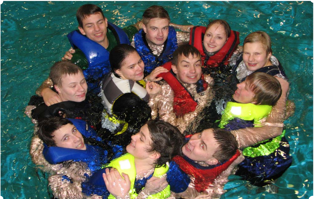
Strandnäs FBK:s ungdomar på besök till Ålands Sjösäkerhetscenter.