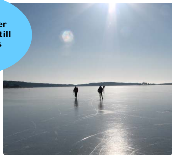
Långfärdsskridskoåkning på Slemmern 6 mars -12

Skicka in bilder från er verksamhet till förbundets hemsida!