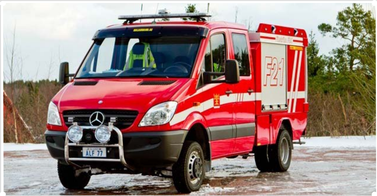
Finströms nya släckningsbil