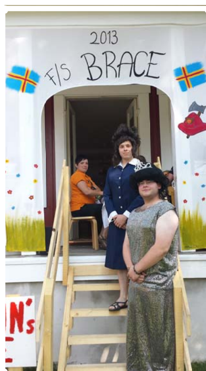
Klart för middag vid Captain's table

Resan nådde sin sluthamn den 27 Juli då en trött men glad besättning och passagerare mönstrade av i väntan på nästa års läger!