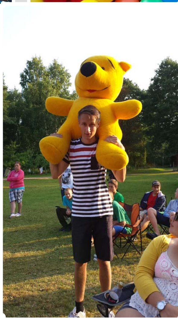
Robin och Nalle Puh väntar på talangafton