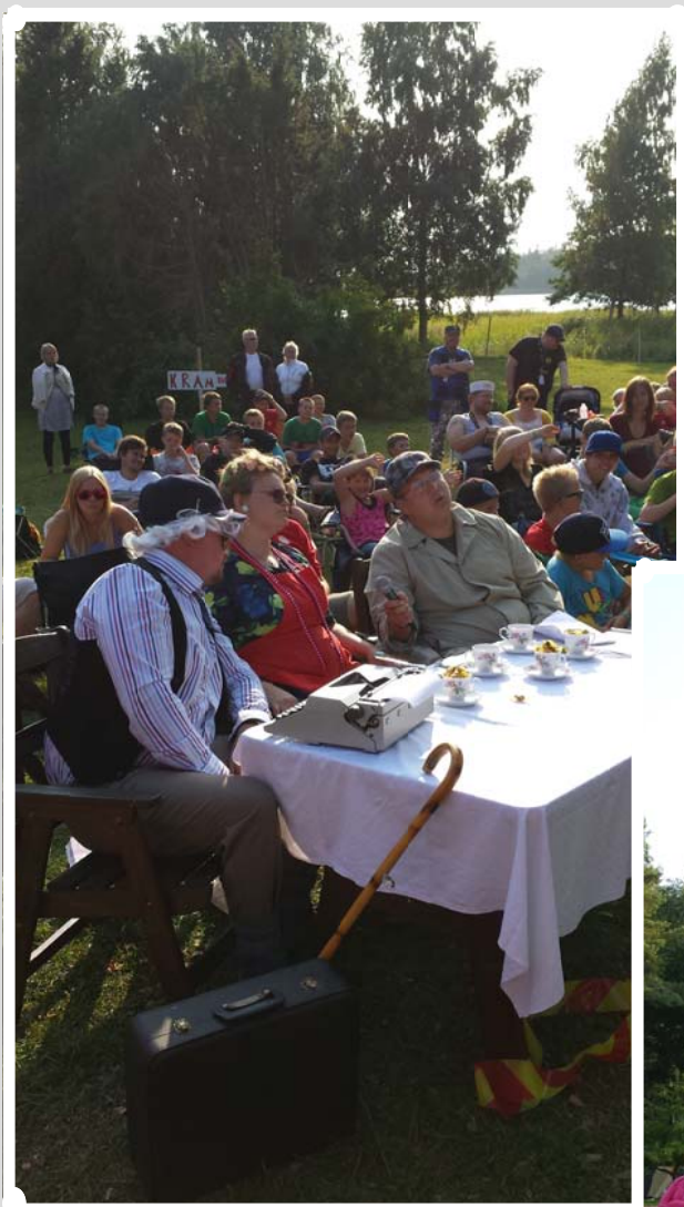
Ungdomar och ledare sam- lade för talangafton