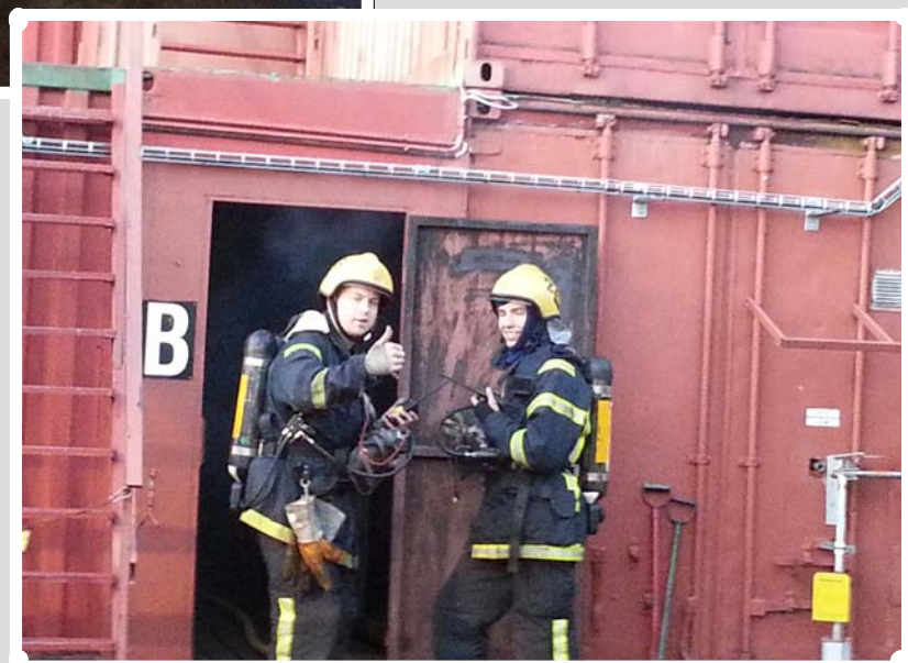
Nöjda kursdeltagare från Finströms FBK