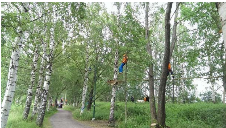
Klätterbanan på lägerområdet