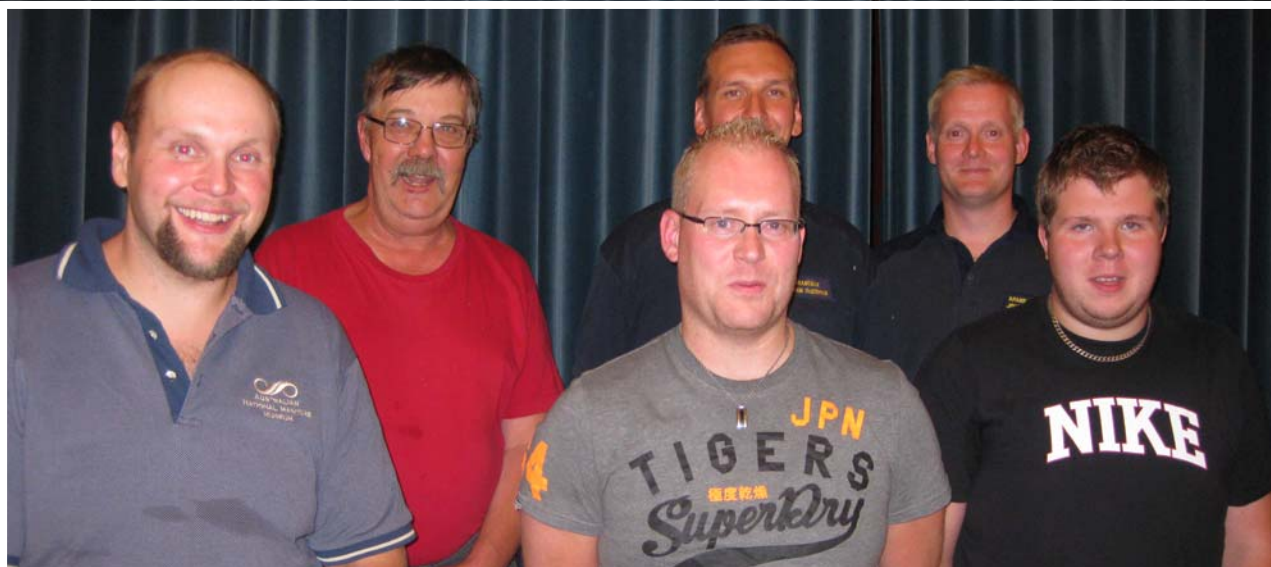
Hela gänget som var i Geta

De åländska brandkårerna håller som bäst på utbildas i prehospital sjukvård och hjärt- och lungräddning.